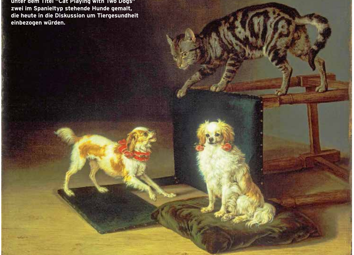
Bild 2: Schon im Jahr 1652 hat Paulus Potter unter dem Titel "Cat Playing with Two Dogs" zwei im Spanieltyp stehende Hunde gemalt, die heute in die Diskussion um Tiergesundheit einbezogen würden.

In den folgenden zehn Kapiteln möchte ich Sachverhalte analysieren, Handlungsvorschläge skizzieren, Züchter zum Mitwirken motivieren und schließlich darlegen, mit welchen Mitteln ein kynologischer Dachverband dabei seiner Verantwortung gerecht werden kann. Die Rollen des VDH und des Weltverbandes Fédération Cynologique Internationale (FCI) werden in diesem Zusammenhang selbstkritisch hinterfragt, denn auch das gehört aus meiner Sicht zu den obligatorischen Aufgaben eines Vorsitzenden.