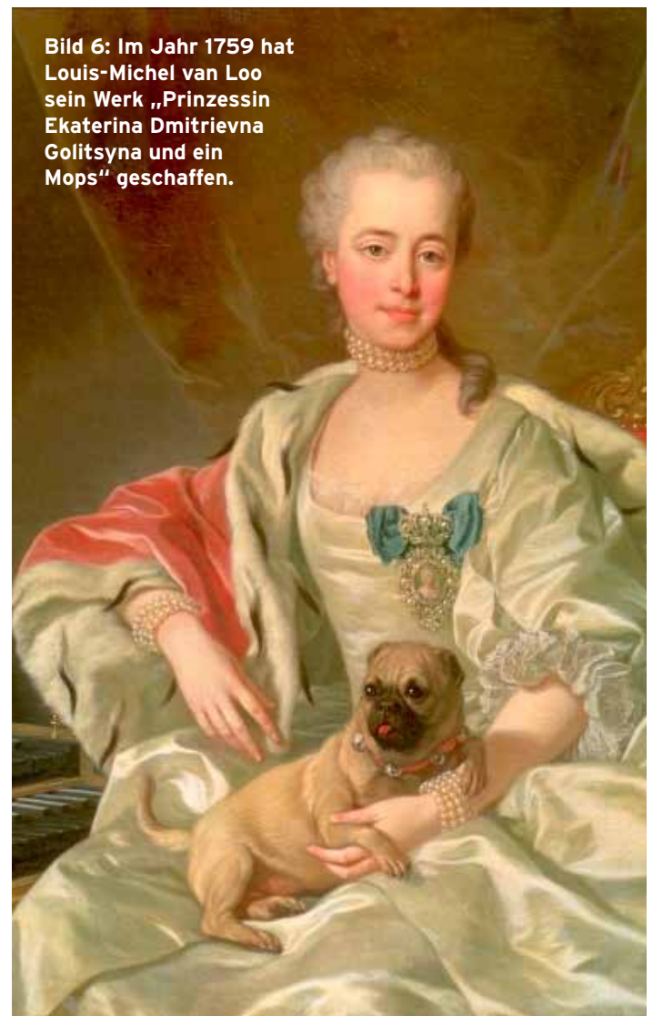
Bild 6: Im Jahr 1759 hat Louis-Michel van Loo sein Werk „Prinzessin Ekaterina Dmitrievna Golitsyna und ein Mops“ geschaffen.

Fest im Griff der Macht der Gewohnheit halten wir es beinahe für eine Selbstverständlichkeit, wenn Experten uns Auskunft über die Beschaf-