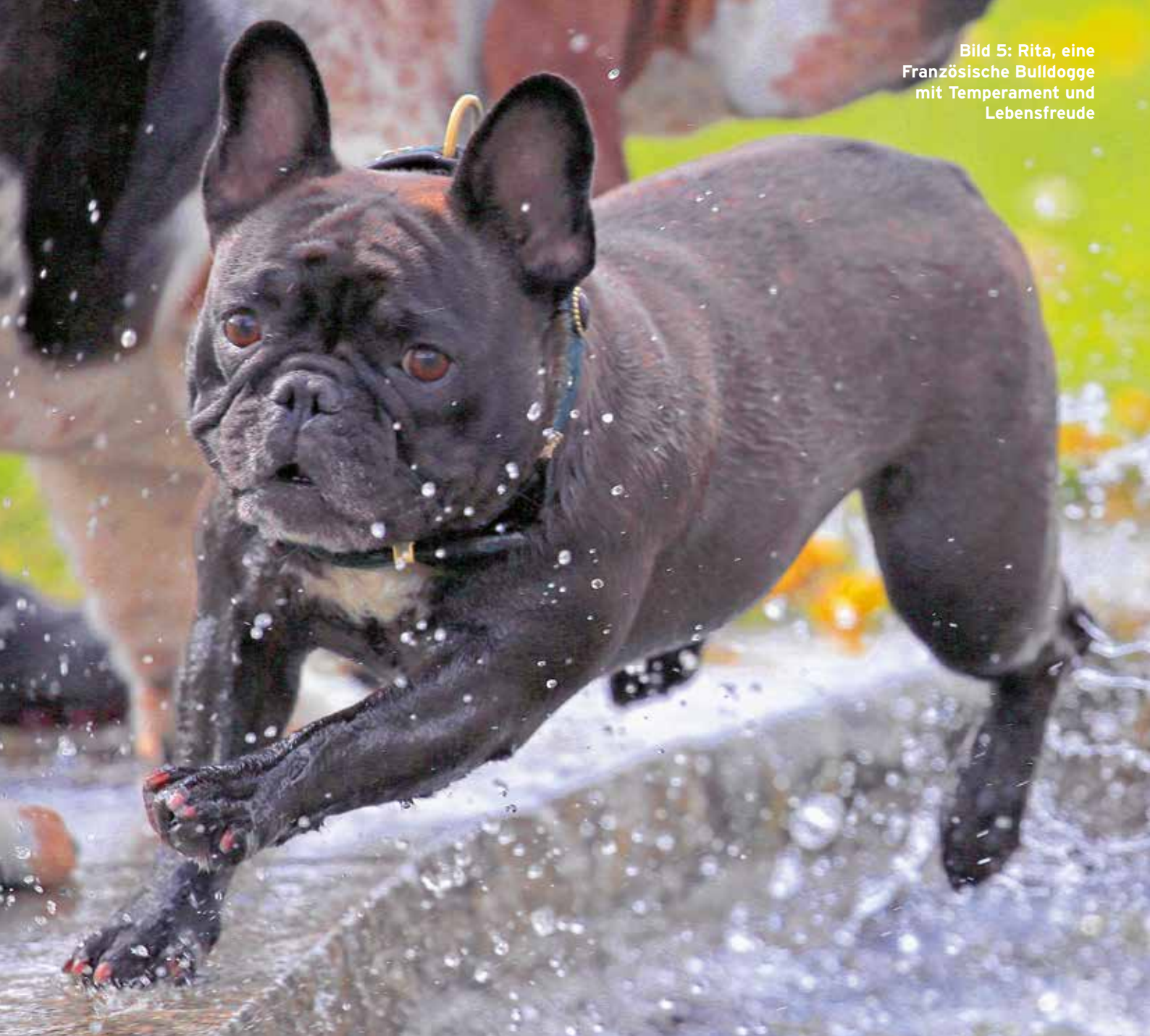
Bild 5: Rita, eine Französische Bulldogge mit Temperament und Lebensfreude