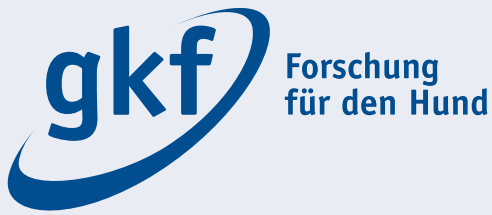
Bild 13: Eine Mitgliedschaft in der Gesellschaft zur Förderung kynologischer Forschung ist jedem Hundefreund zu empfehlen.

stammt aus kontrollierter Zucht, und dort, wo die Behörden selbst Zuchten betreiben, gehen diese zu einhundert Prozent auf viele Jahrzehnte lang währende kontrollierte private Zucht zurück. Es gibt demgegenüber auch weniger ernsthafte Züchter, die weder die Gesundheit noch das Verhalten auf die Probe stellen, die es mit den Zuchtstätten weniger genau nehmen und von denen auch Welpen veräußert werden, deren Verfälschung zu wünschen übrig lässt. Das Mindeste, was seriöse Züchter von Politikern und Wissenschaftlern verständlicherweise erwarten, ist, dass bei Entscheidungen und Untersuchungen der Unterschied zwischen kontrollierter und unkontrollierter Zucht einbezogen wird und eine gründliche Prüfung dahingehend stattfindet, wie sich beide in ihren Resultaten unterscheiden. Fatal und beschämend wäre es, würden Daten an Hunden aus unkontrollierter Zucht gewonnen und mit Berufung auf gerade diese auch die kontrollierte Zucht der betreffenden Rasse verboten, weil die Herkunft der Hunde desinteressiert ignoriert würde. Die geschmuggelten Welpen vom Parkplatz nebenan führten dann zu einem Verbot eines respektablen Umgangs mit Tieren. Im Falle rechtlich bindender Entscheidungen und auf Brachycephalie bezogener Analysen, die die Existenz kontrollierter Zucht gegenüber unkontrollierter Vermehrung mit Nichtachtung strafen, verdienten weder die Entscheider noch die Analytiker Auszeichnungen, sondern vielmehr wahrhaft kritische Rezensionen.