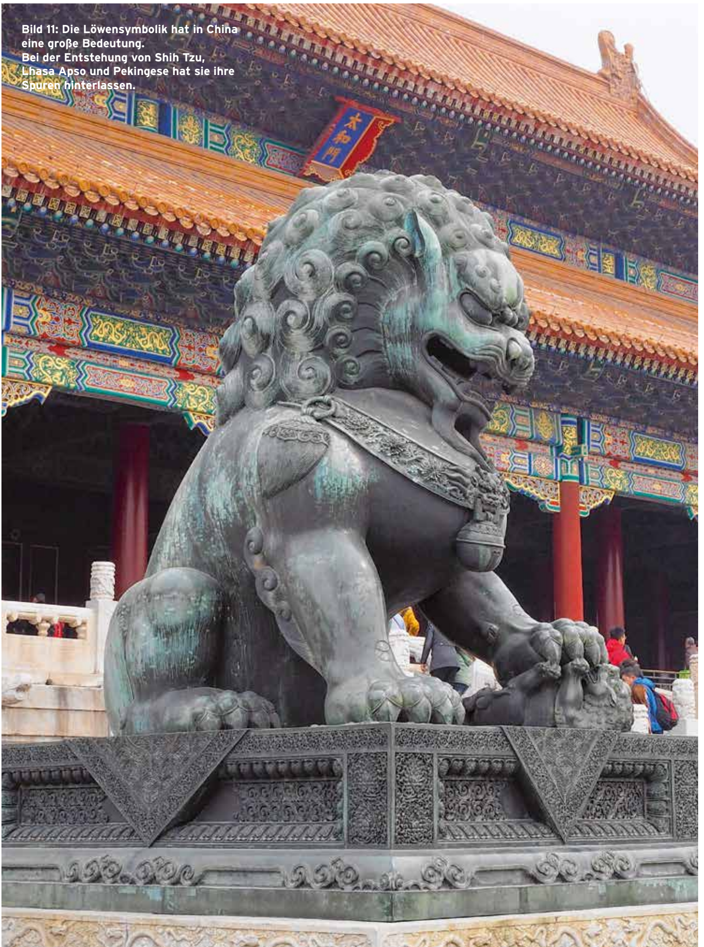
Bild 11: Die Löwensymbolik hat in China eine große Bedeutung. Bei der Entstehung von Shih Tzu, Lhasa Apso und Pekingese hat sie ihre Spuren hinterlassen.